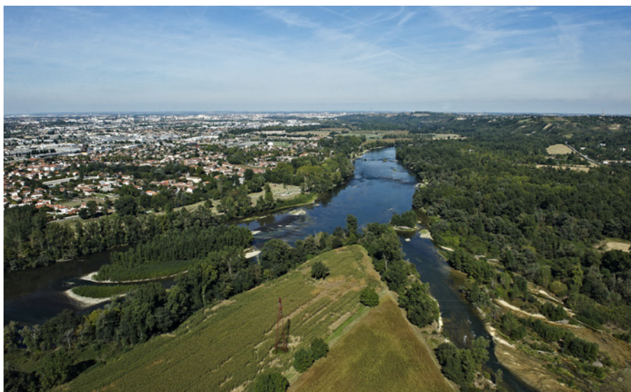
Vue aérienne de la confluence de l'Ariège et de la Garonne en Haute-Garonne

Le SAGE est une formidable opportunité de nous engager collectivement, solidairement, un outil précieux de partage de notre action et de retours d'expériences sur de nombreux sujets. Il encouragera les élus comme les usagers dans le portage d'une vision de long terme volontariste pour répondre à des enjeux cruciaux.